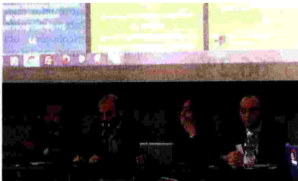
Una delle sessioni di ePic 2017, XV conferenza internazionale dedicata a pratiche e tecnologie dell'apprendimento e del suo riconoscimento (Bologna, ottobre 2017)